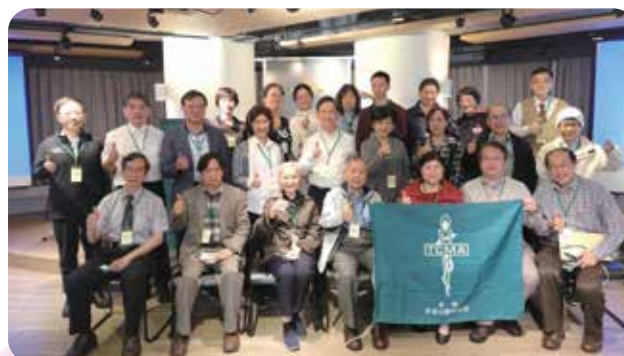
會員大會後部分會員合影