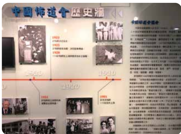
中佈會總部的歷史牆