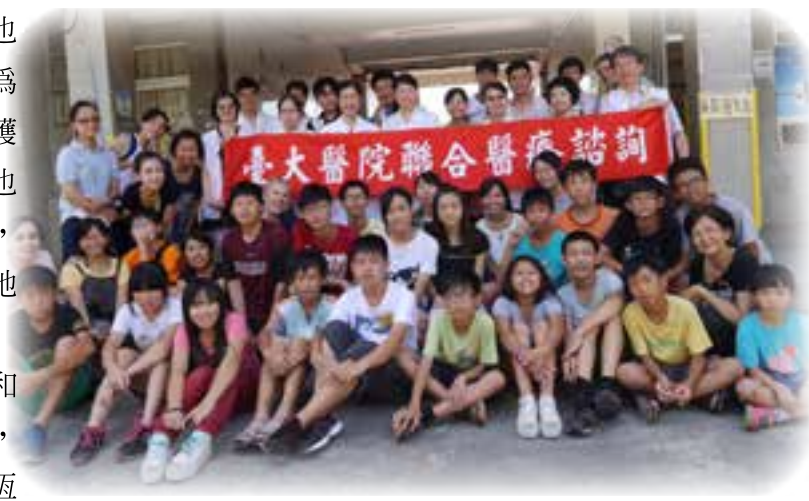
義診團在屏東萬丹鄉新興國小與當地K書中心營會學童合影

（作者：臺大醫院愛心團契社長、臺大臨床牙醫學研究所教授兼所長、臺大醫院牙體復形美容牙科主任）