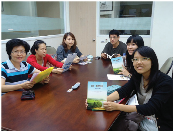
↑圖書館相見歡留影

上帝啊！幫助我「醫學生」們，讓我們所有的想法具備高尚的意圖、周嚴全備的努力和學習。無論是遇到順境或逆境的醫療環境中，並且我們還能始終支持、負責和忠實地完成這些高尚的任務。