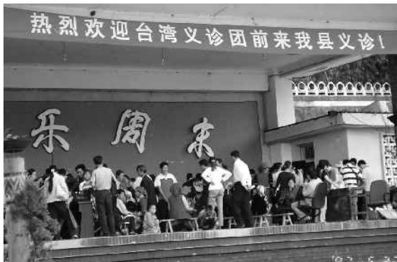
↑ 在無適當場所情況下活動中心的司令台 成爲門診區與藥局 眼科看診 →