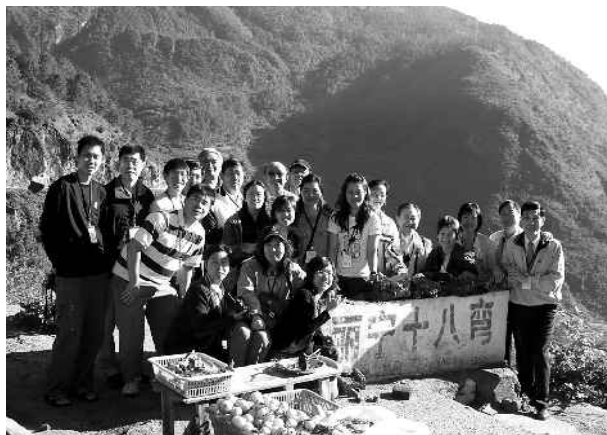
義診隊在彎曲的山路旁合影